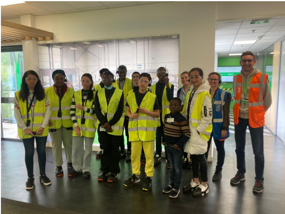
Visite de l'usine MasterTech à Grenoble